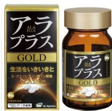
アラプラス ゴールド