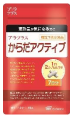
アラプラス からだアクティブ