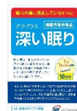
アラプラス 深い眠り