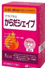
アラプラス からだシェイプ