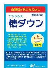
アラプラス 糖ダウン