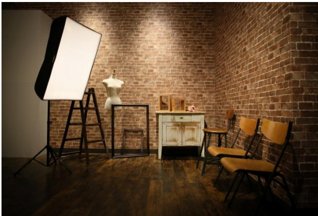
本社会議室を有効活用した写真館スタジオ