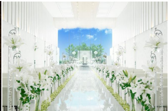
エスクリが運営する首都圏の結婚式場でも撮影可能